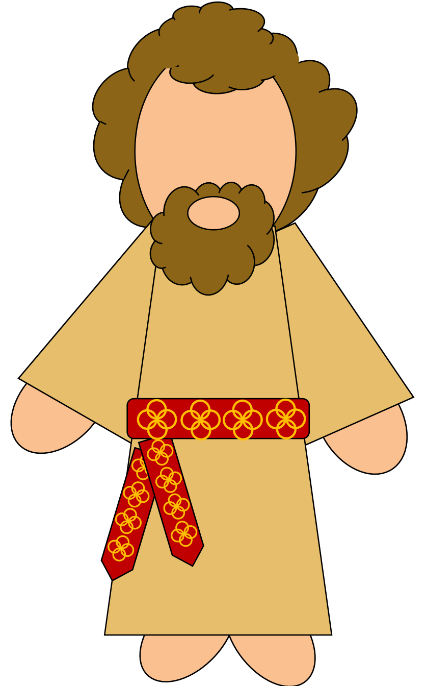
Jacob et Esaü