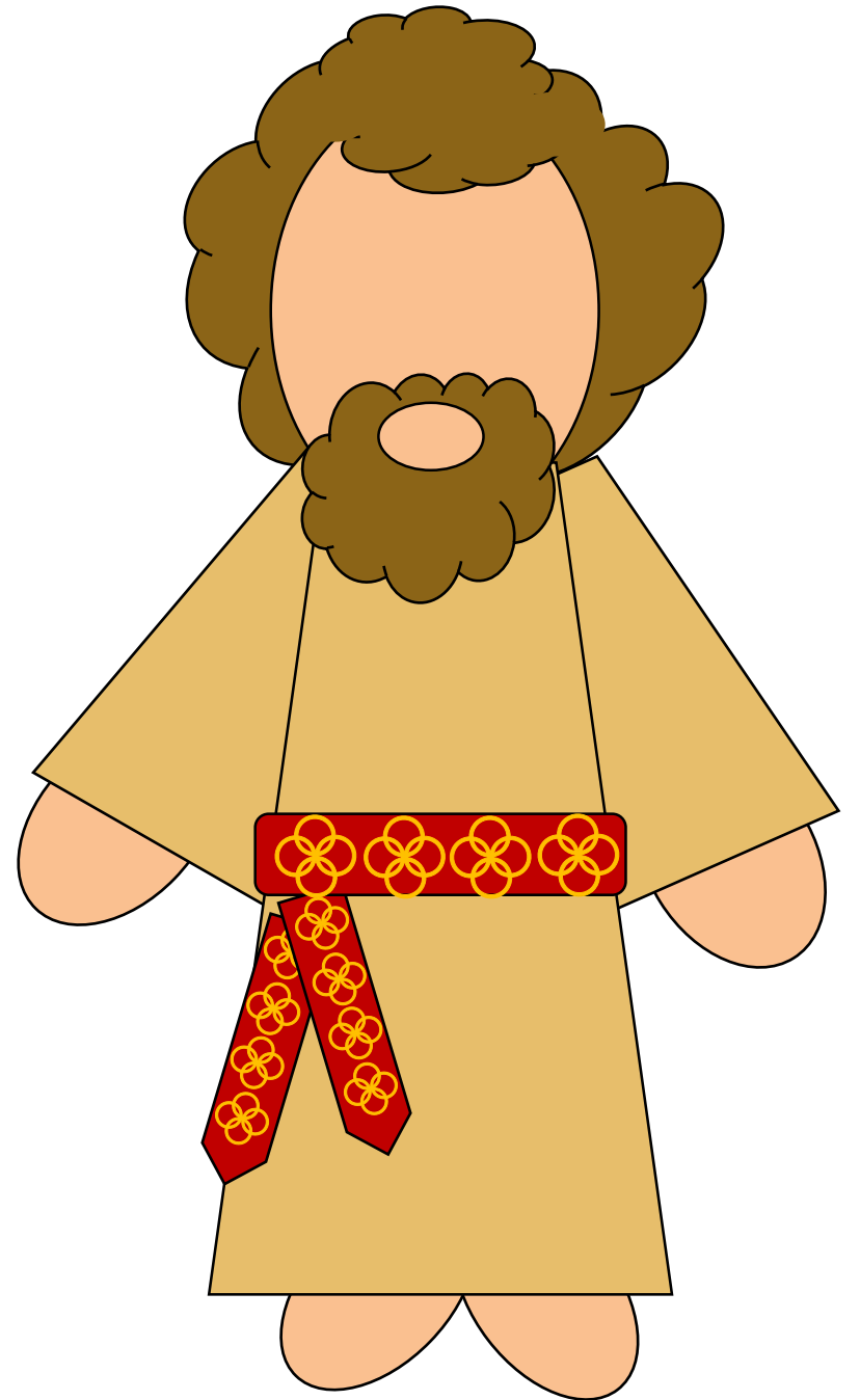
Jacob and Esau